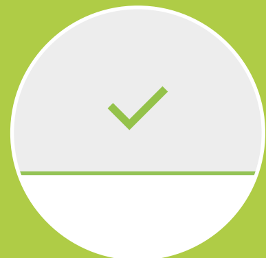
Keime werden schnell und effektiv inaktiviert.